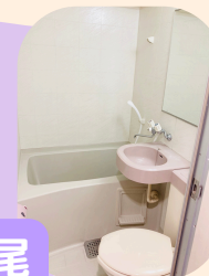
あいむほーむ広尾